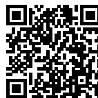
График набора групп и обучения: